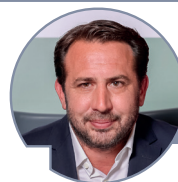
avec l'aimable participation de Pierre GUYS